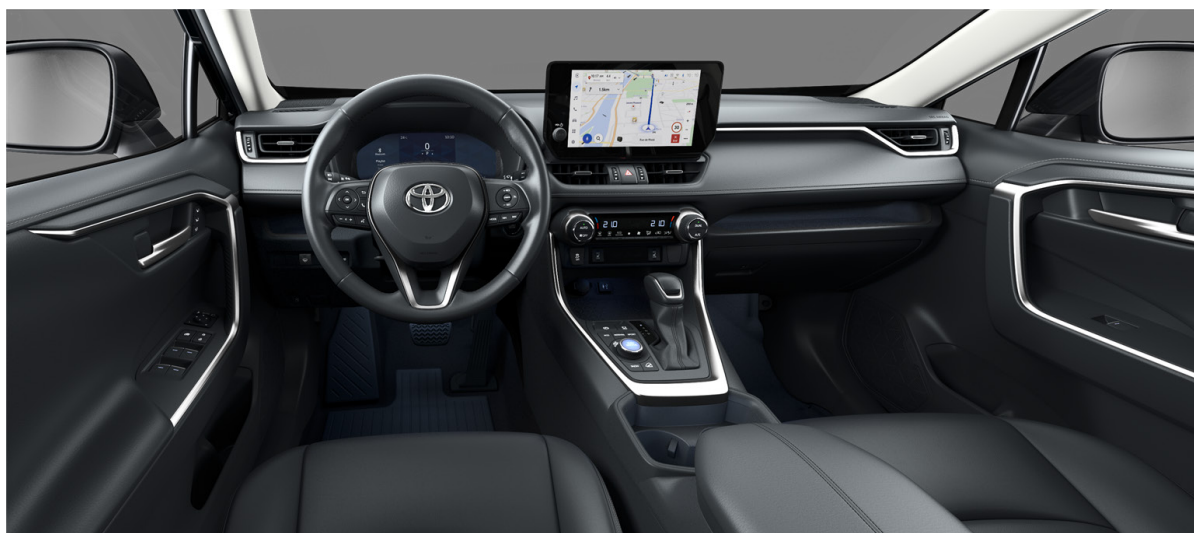
Кожа чёрного цвета (LA20) Комплектации "Люкс" и "Люкс+"