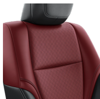
Кожа красного цвета (LA30) Комплектации "Премиум" и "Премиум+"