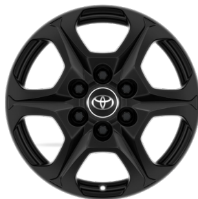
Легкосплавные диски 18" Комплектации "Престиж Off-road" и "GR Sport"