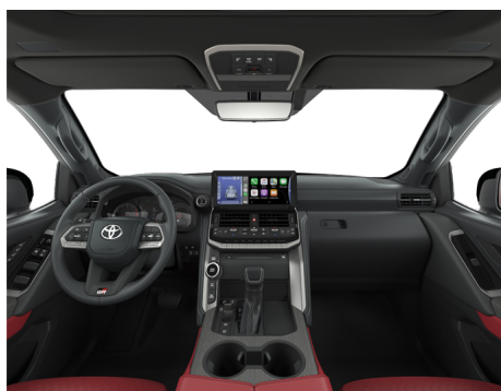
Кожа красного цвета GR Sport (LA31) Комплектация "GR Sport"