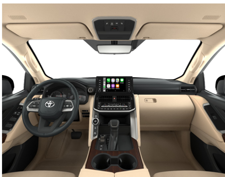
Кожа бежевого цвета (EA40) Комплектации "Престиж" и "Престиж off-road"