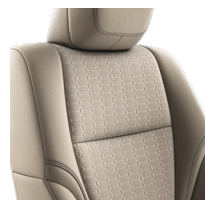
Кожа бежевого цвета (LA40) Комплектации "Люкс", "Премиум" и "Премиум+"