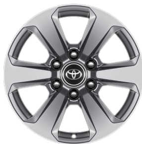
Легкосплавные диски 18" Комплектация "Престиж"