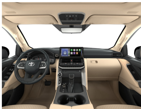
Кожа бежевого цвета (LA40) Комплектации "Люкс", "Премиум" и "Премиум+"