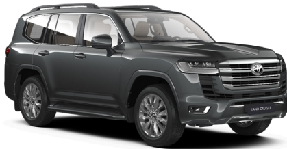
Серый металлик (1G3)