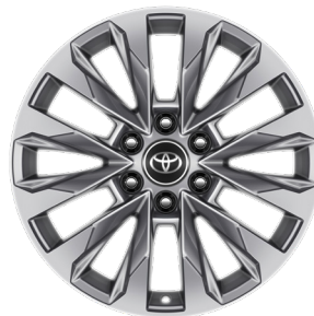
Легкосплавные диски 20" Комплектации "Люкс", "Премиум" и "Премиум+"