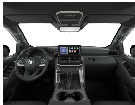
Кожа чёрного цвета (LA20) Комплектации "Люкс", "Премиум" и "Премиум+"