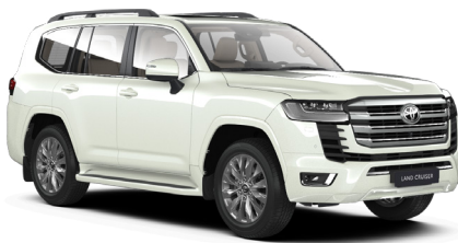
Белый жемчуг премиум (070)