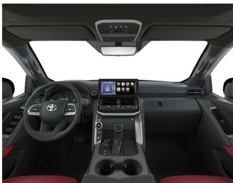
Кожа красного цвета (LA30) Комплектации "Премиум" и "Премиум+"