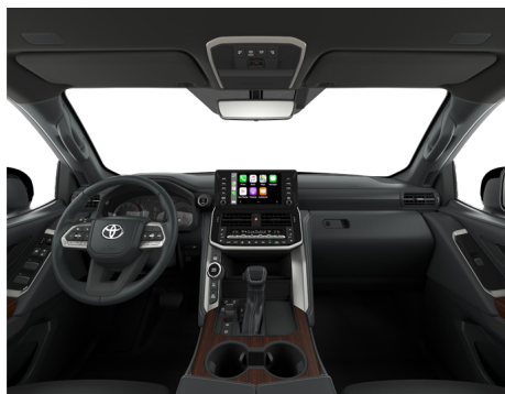
Кожа чёрного цвета (EA20) Комплектации "Престиж" и "Престиж off-road"