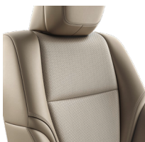
Кожа бежевого цвета (EA40) Комплектации "Престиж" и "Престиж off-road"