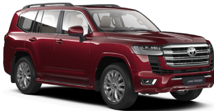
Тёмно-красный металлик (3Q3)