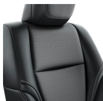
Кожа чёрного цвета (EA20) Комплектации "Престиж" и "Престиж off-road"