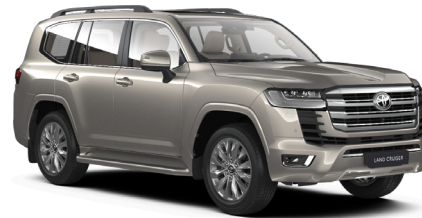
Бронзовый металлик (4V8)