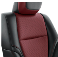
Кожа красного цвета GR Sport (LA31) Комплектация "GR Sport"