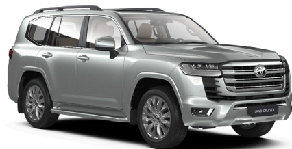
Серебристый металлик (1F7)