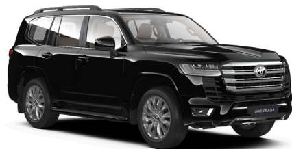
Чёрный металлик (218)