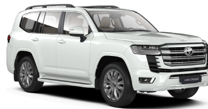
Белый премиум (090)