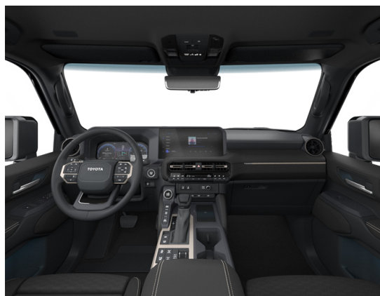
Кожа чёрного цвета (LB20) Комплектации "Люкс" и "Люкс+"