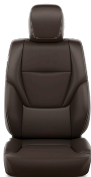
Искусственная кожа тёмно-каштанового цвета (EB40) Комплектации "Престиж"