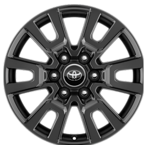
Легкосплавные диски 18" Комплектации "Комфорт" и "Комфорт+"