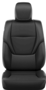
Искусственная кожа чёрного цвета (EB20) Комплектации "Комфорт", "Комфорт+" и "Престиж"