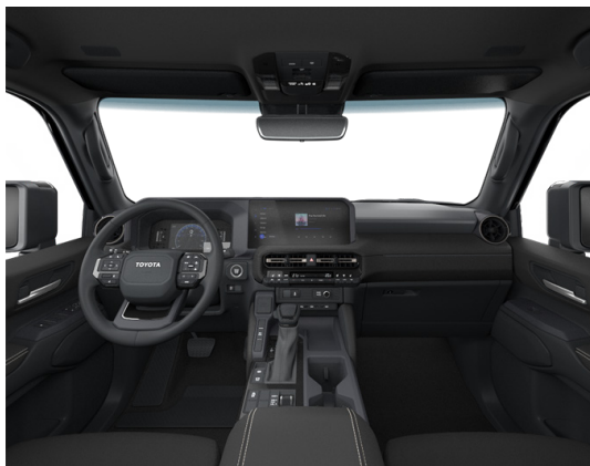
Искусственная кожа чёрного цвета (EA20) Комплектация "Комфорт+"