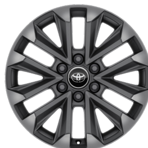
Легкосплавные диски 20" Комплектации "Люкс" и "Люкс+"