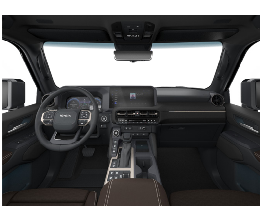
Кожа тёмно-каштанового цвета (LB40) Комплектации "Люкс" и "Люкс+"