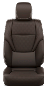
Кожа тёмно-каштанового цвета (LB40) Комплектации "Люкс" и "Люкс+"