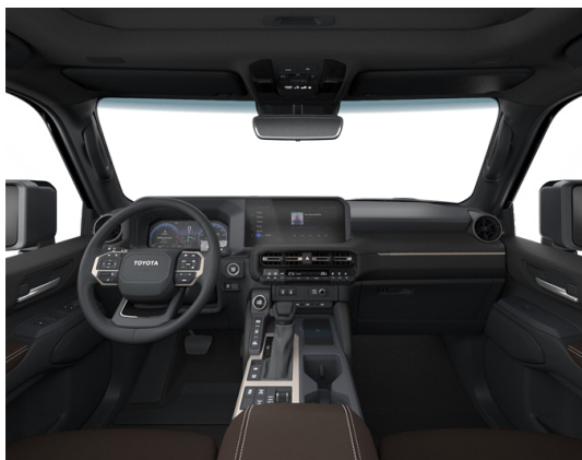
Искусственная кожа тёмно-каштанового цвета (EB40) Комплектация "Престиж"