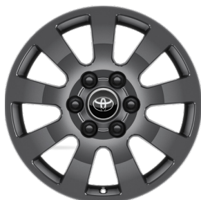
Легкосплавные диски 18" Комплектация "Престиж"