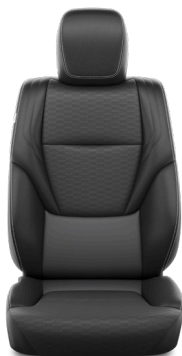
Кожа чёрного цвета (LB20) Комплектации "Люкс" и "Люкс+"