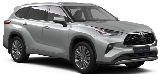
Серебристый металлик (1J9)