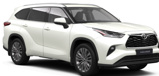
Белый жемчуг премиум (089)