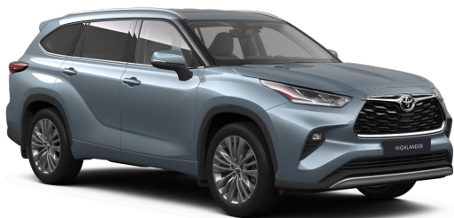
Серо-голубой премиум (1K5)